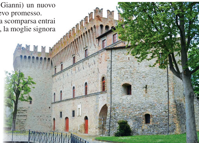
Piandimeleto, Castello dei Conti Oliva

E qui, storia e leggenda si miscelano in un unicum impossibile da separare, troppi anni