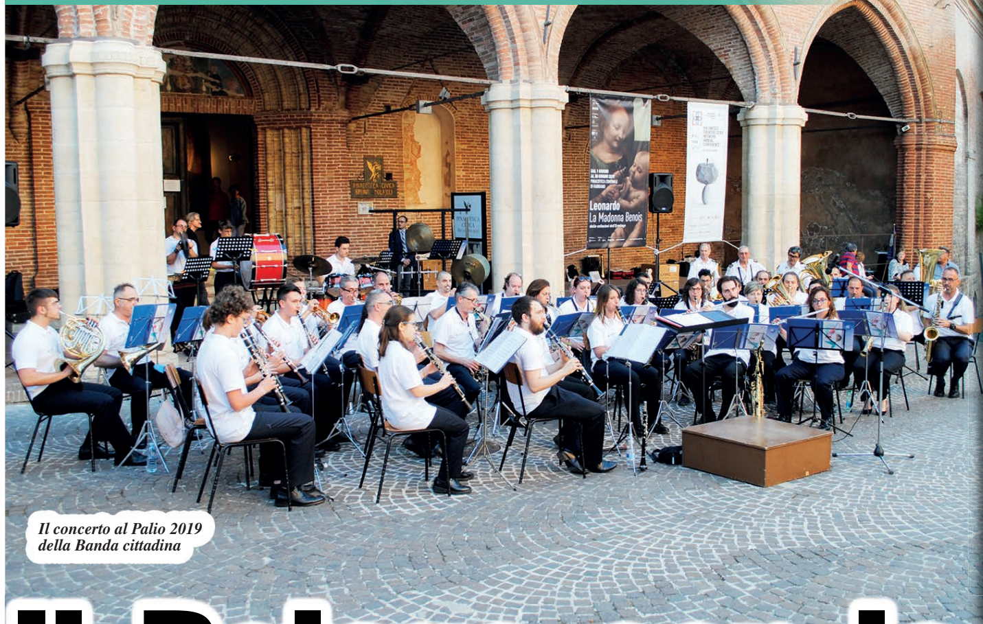
Il concerto al Palio 2019 della Banda cittadina