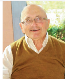
Domenica 17 novembre, a 91 anni, è mancato all'affetto dei suoi cari