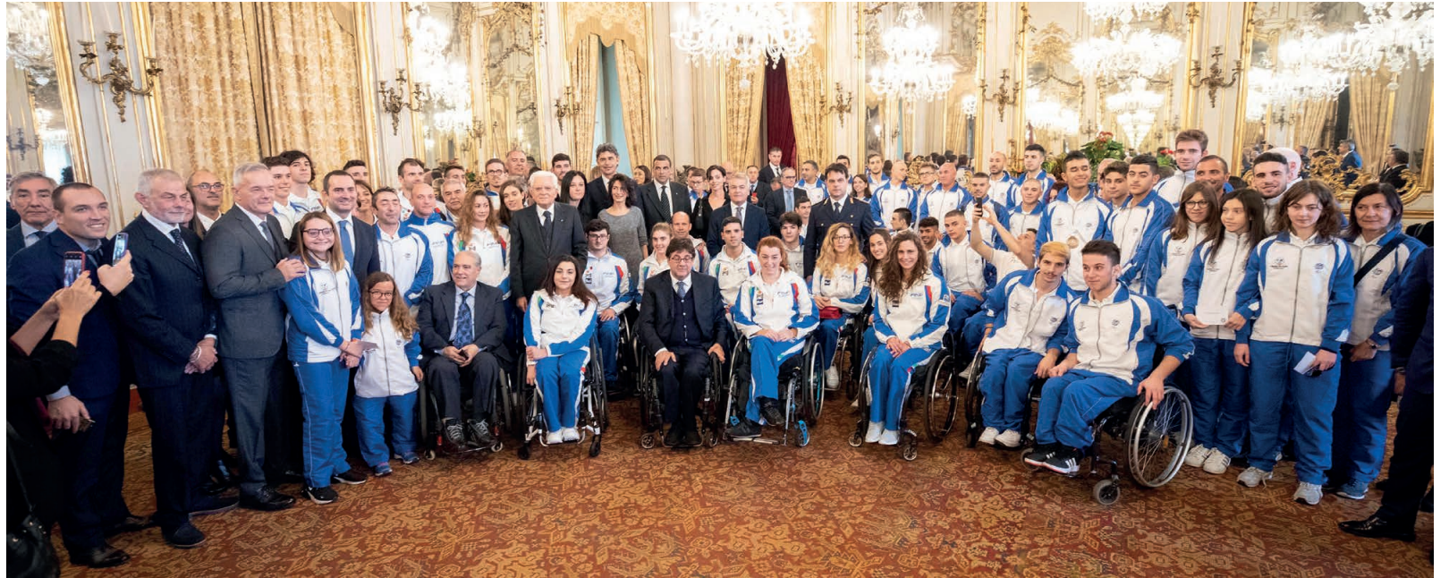
La Nazionale Italiana Finp ricevuta al Quirinale dal presidente della Repubblica Sergio Mattarella