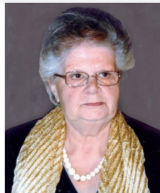
Mercoledì 13 novembre, con i conforti della Fede, è mancata all'affetto dei suoi cari, all'età di anni 83