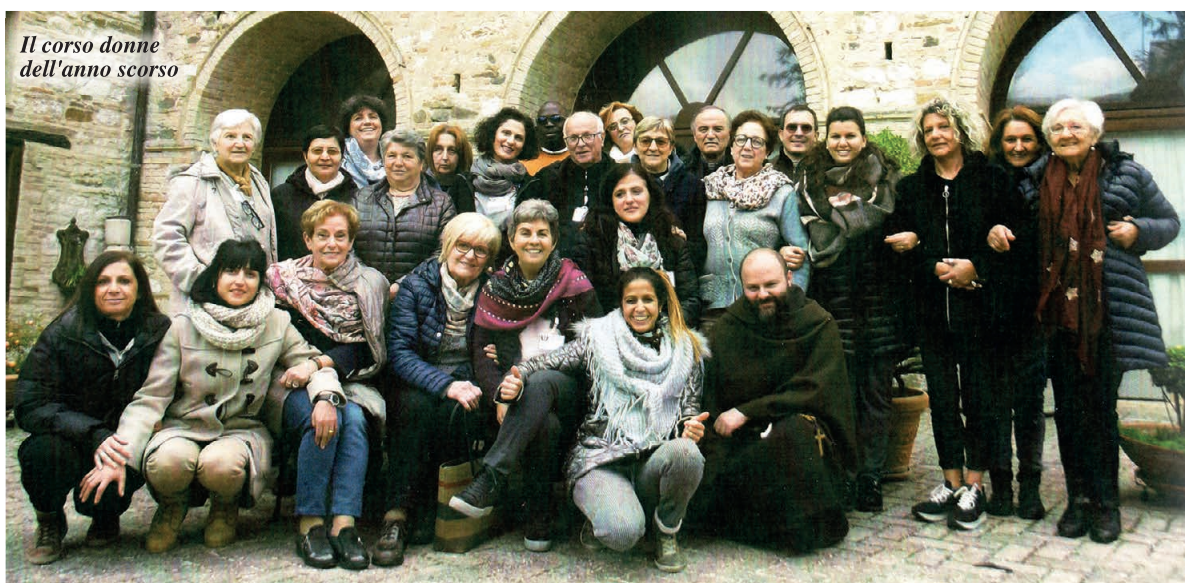
Il corso donne dell'anno scorso

Il prossimo 28 novembre si terrà a S. Severino il 37° Corso di Cristianità Donne. Esperienza di cui sono una veterana, in quanto la feci nel lontano 1977 all'età di 33 anni. Ero stata educata nella fede sia in famiglia che nella scuola e in parrocchia, ma sicuramente l'esperienza del corso è stata decisiva per trasformare la mia fede "bambina" e poco incisiva nella pratica della vita quotidiana, in una fede adulta che sente la necessità di una effettiva testimonianza cristiana in ogni ambito di vita, aiutata in ciò da mio marito che è stato un tesoro. Quei tre giorni sono stati per me importanti, in quanto hanno prodotto un cambiamento: ciò che prima appariva confuso, frammentario e poco convincente si è svelato in modo nuovo. Ho compreso quanto i contenuti della fede siano coerenti tra loro e corrispondano a quella ricerca della verità che non riuscivo a trovare in altri contesti. I contenuti