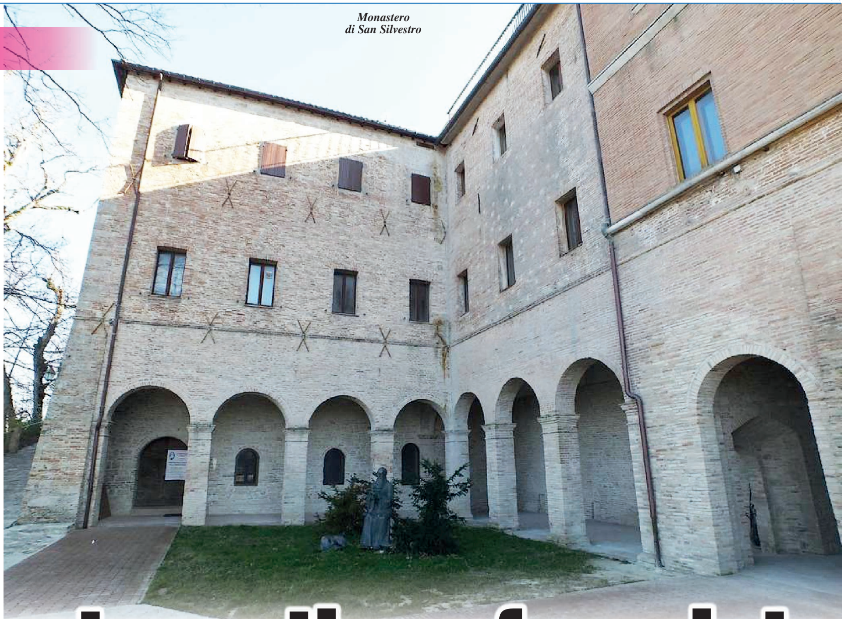
Monastero di San Silvestro

- Triduo di preparazione (22-24 novembre): alle ore 18 recita dei Vespri e lettura di brani della Vita Silvestri. - 23 novembre: durante la celebrazione dei Vespri si svolge il rito di oblazione di 15 nuovi oblato del monastero di San Silvestro. - 25 novembre: alle ore 18 canto dei Primi Vespri della solennità di San Silvestro. - 26 novembre: alle ore 11.30 concelebrazione presieduta da Mons. Angelo Spina, Arcivescovo Metropolitano di Ancona-Osimo; alle ore 18.30 Secondi Vespri della solennità di San Silvestro.