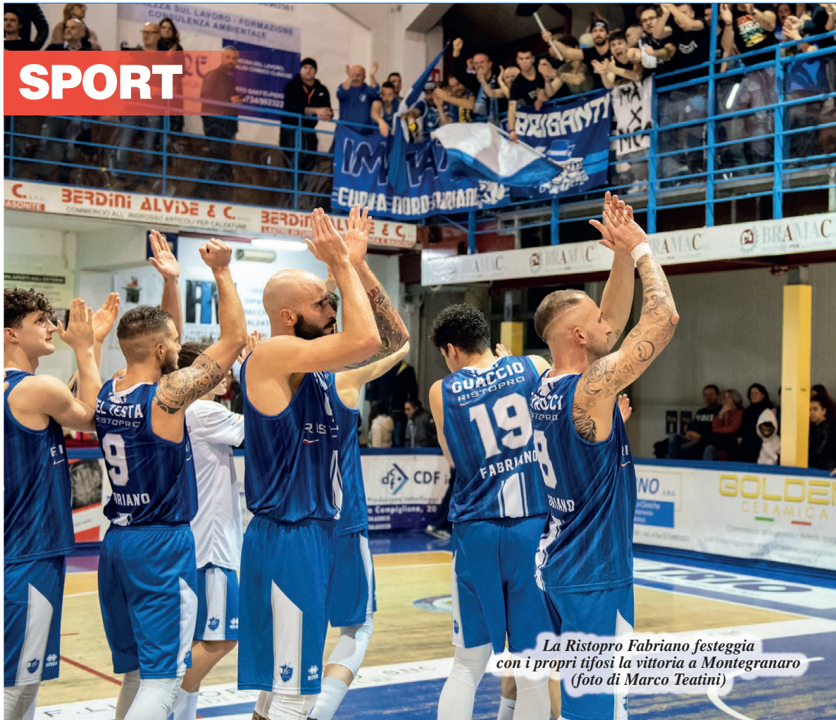
La Ristopro Fabriano festeggia con i propri tifosi la vittoria a Montegranaro