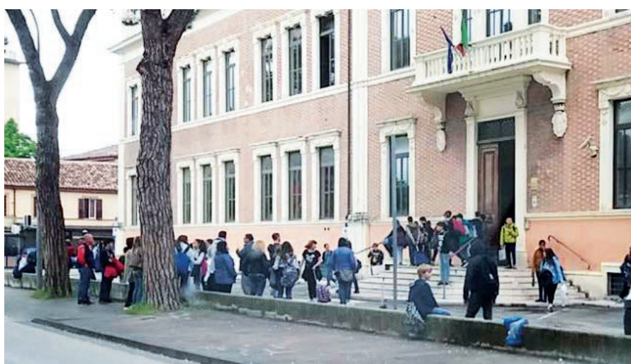
La Giovanni Paolo II nella sede dell'ex tribunale