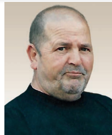
Lunedì 11 novembre, a 75 anni, è mancato all'affetto dei suoi cari