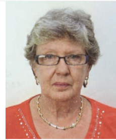
CHIESA della SACRA FAMIGLIA Sabato 30 novembre ricorre il trigesimo della scomparsa dell'amata