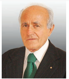
CHIESA di SAN FILIPPO Mercoledì 27 novembre ricorre il trigesimo della scomparsa dell'amato