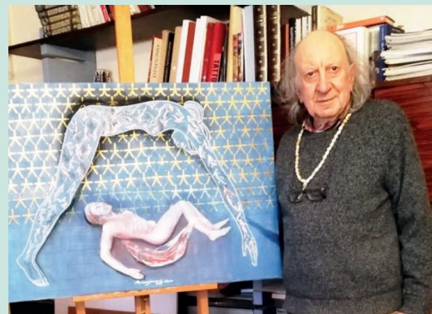
Spoleto e al Centro design Poliarte di Ancona.

na, dove sono state ammirate quaranta opere create con le tecniche grafiche. Afferma Moschini: "L'obiettivo è quello di rendere la cultura un bene comune fruibile da tutti. L'8 dicembre è un'ennesima opportunità che mi piace offrire a Fabriano e al comprensorio". Da menzionare anche l'altra rassegna intitolata "Il profumo dei suoni attraverso il colore: Egitto. Un'umanità sospesa tra storia e poesia" in Corso della Repubblica, visitata e partecipata da un numeroso pubblico, e che rappresenta la riflessione estetica tra pittura di paesaggio ed evocazioni di matrice simbolista. Al riguardo, se mai c'è ne fosse bisogno, va detto che Roberto Moschini è un pittore, scultore, incisore e ricercatore. Dal 1956 ad oggi ha esposto in personali e collettive nazionali ed internazionali di prestigio ed è autore di numerosi saggi (tra gli altri "La presenza inquietante", che fu presentato da Federico Fellini). Vanta anni d'insegnamento negli istituti di Urbino, Bologna,