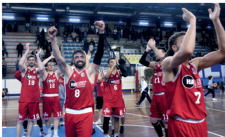
La felicità dell'Halley per la vittoria a Foligno