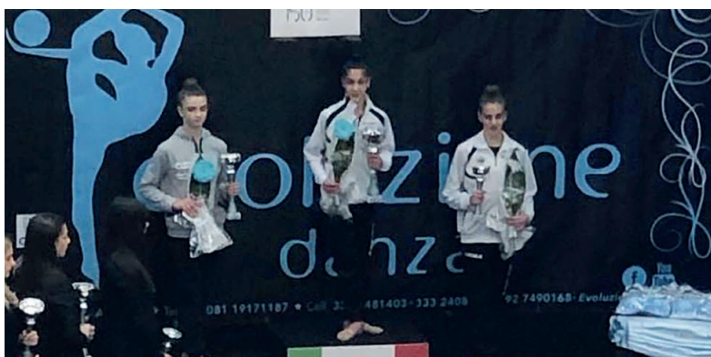
Le "faberine" sul podio a San Giorgio a Cremano (Na)

A San Giorgio a Cremano le nostre ginnaste sugli scudi