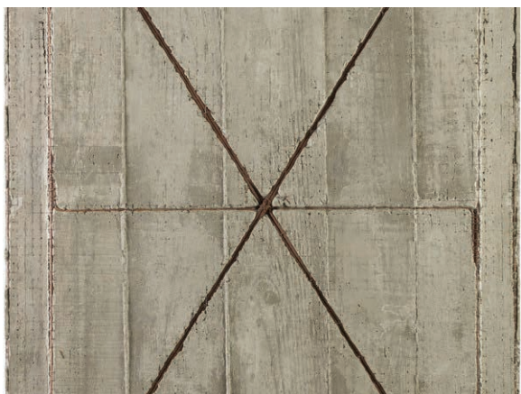
Giuseppe Uncini, Cementoarmato n.31 , 1962. Collezione Permanente Macte

dalla mostra Giuseppe Uncini /Termoli 2019 è quello di valorizzare la storia del Premio Termoli, rendendo la Collezione Permanente del Museo luogo e punto di partenza per un dialogo e un confronto tra artisti di diverse generazioni, grazie a un programma espositivo che, accanto agli approfondimenti sui maestri dell'arte italiana degli anni