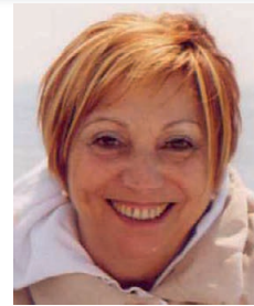
CHIESA della SACRA FAMIGLIA Sabato 30 novembre alle ore 18 nell'anniversario ricordiamo